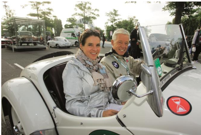
BU: Katarina Witt ist seit Jahren treue Teilnehmerin der Hamburg-Berlin-Klassik