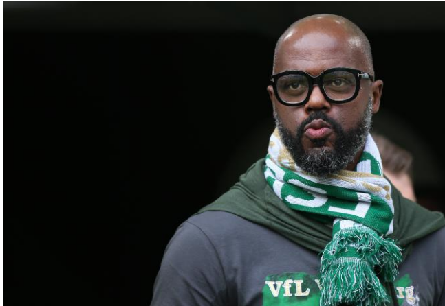
BU: Grafite, Teil der Wolfsburger Meistermannschaft 2009, kehrt in die Autostadt zurück